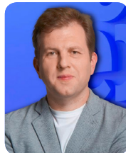
德米特里·谢尔盖耶夫