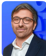
列昂尼德·多夫拉德贝吉安